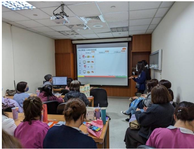
112 定期舉辦護理指導