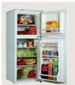
冷藏室放蛋的地方