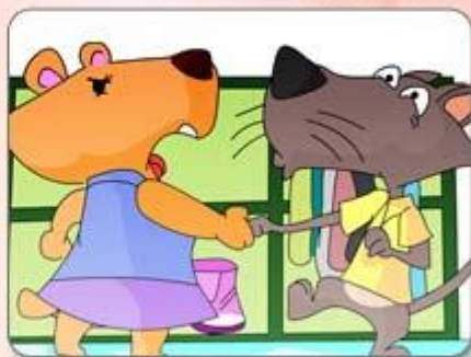
● 要求對方停止該舉動