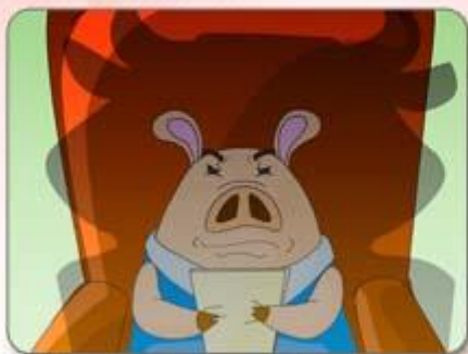
● 護衛自己的身體控制權