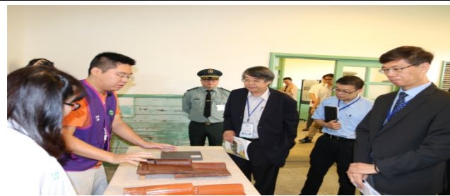
穿越時空的古蹟療癒