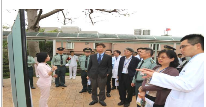
溫泉代幣精神醫療