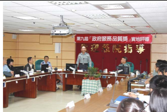
副部長及總督察長至本院指導