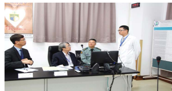
自殺防治關鍵時刻通報系統