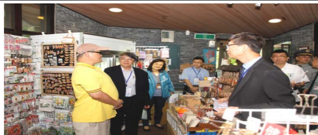
地熱谷職能治療小舖