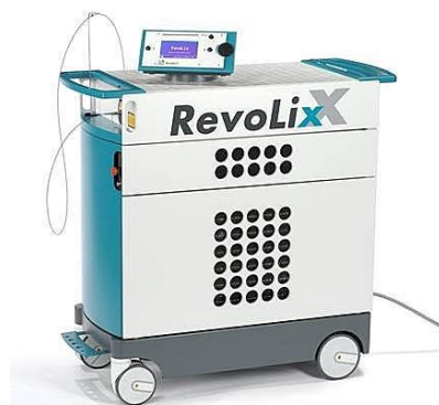
圖一 鈹雷射手術機器

經尿道前列腺雷射汽化切除術，採用最新型的RevoLix鈹雷射(圖一)，具有良好的組織切割及組織汽化的效果，本身特性兼具有汽化、切割及止血的功能，因此可以於術中取得手術組織檢體進行病理檢驗，分辨良性及惡性病灶。其優點為止血功能優異，術中幾乎不出血、安全性較高、術後恢復快速、導尿管放置時間短、住院時間短，缺點為手術全自費。