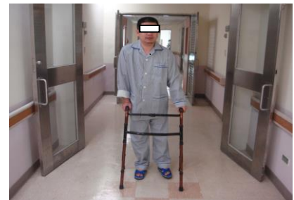
圖五 雙手用力撐起身體，健肢向前