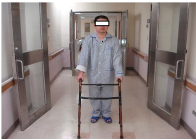
圖三 助行器向前 25~30 公分