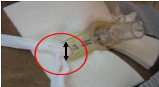
圖二 氣切套管固定帶寬度 2 公分 Gambar 2 Lebar pita pengikat pipa luka trakeotomi adalah 2 cm

Pipa luka trakeotomi tidak boleh diganti dalam waktu 1 bulan setelah pemasangan untuk mencegah stoma menutup.