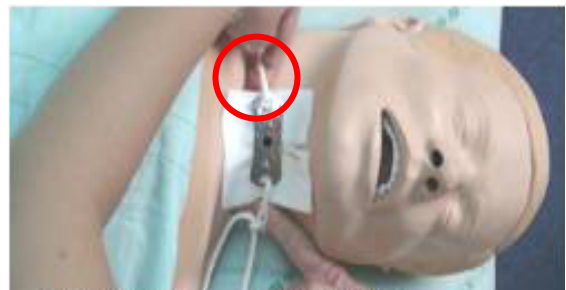
圖三 固定帶與頸部間須留 1 指寬 Gambar 3 Lebar antara pita pengikat dan leher harus 1 jari