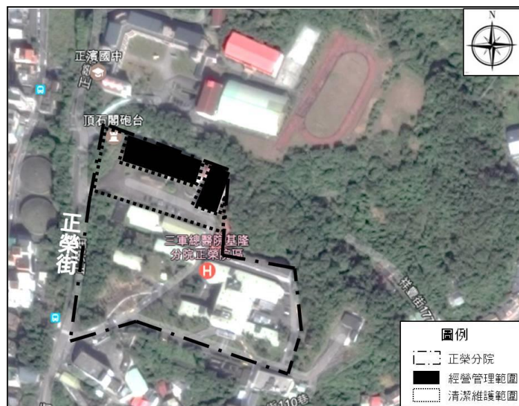
圖 1-1-1 基地範圍示意圖

為減輕主辦機關管理維護負擔，本計畫經營管理範圍周邊之停車場及空地，民間機構亦需負日常清潔之義務，土地面積約 4,600 m 2 (以實地點交與測量結果為準)。其中道路、停車場、植栽等公共設施由主辦機關負責，日常清潔維護 (如環境清潔、一般落葉及垃圾清掃等) 由民間機構負責。如發生不可抗力如天災、颱風等情事導致樹木傾倒或有清運之需求，則由民間機構通報主辦機關處理。