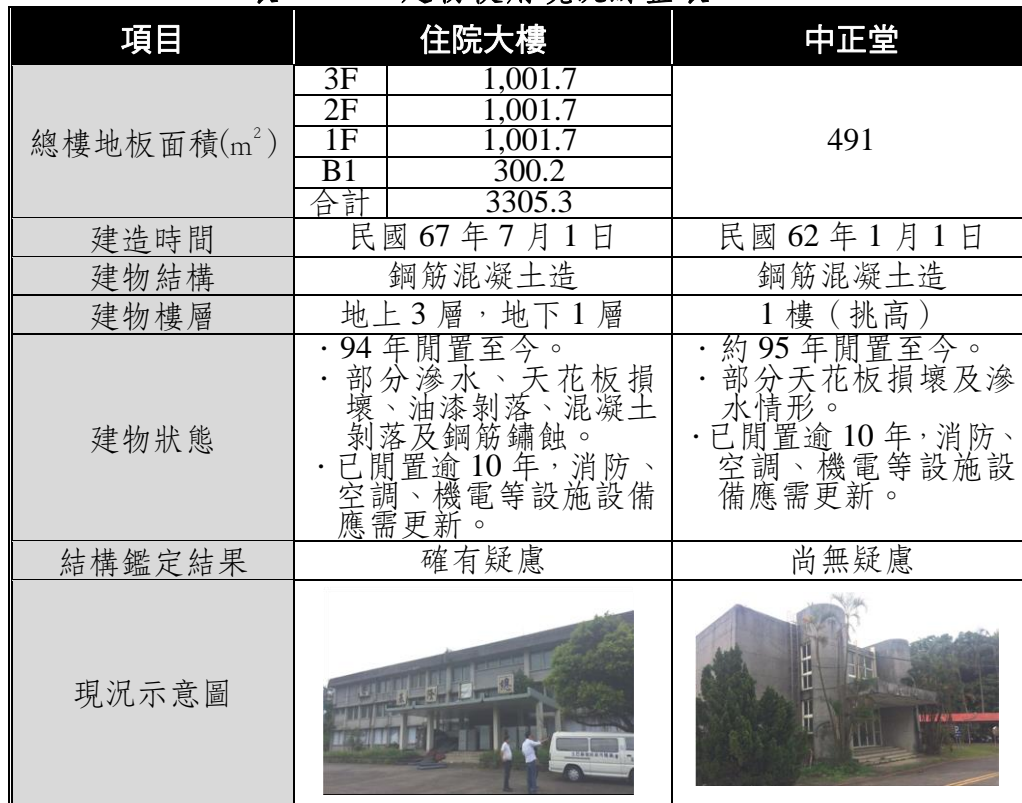
表 1-1-1 建物使用現況綜整表

資料來源：1.三軍總醫院附設基隆民眾診療服務處 2.民國 106 年 7 月 3 日三軍總醫院附屬基隆民眾診療服務處建築物耐震能力初步評估成果報告書 3.本計畫整理